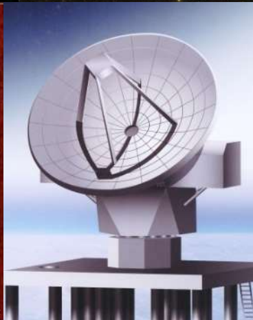
南極10m級電波望遠鏡 (完成予想図)